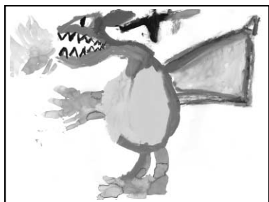
山本 悠人くん(小2) いつもでも兄弟仲良くね