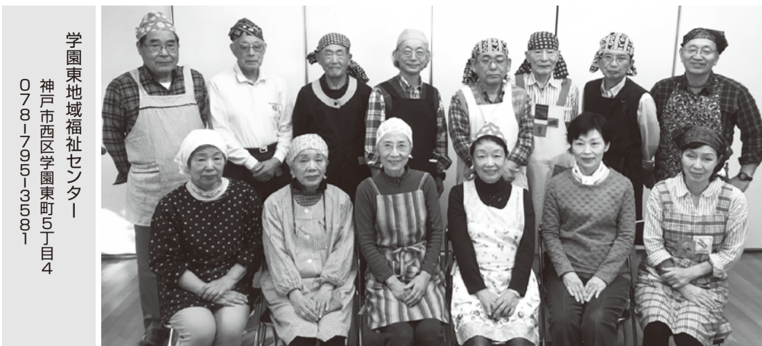
学園東地域福祉センター

いつもラディッシュ新聞を愛読下さりありがとうございます。垂水・西神店はエリア拡大の為に今年1月から須磨長田店と統合することになりました。西神戸地域の顧客様が大幅に増え「これまで以上にサービス向上への努力を」と身の引き締まる思いです。営業マンやリフォームチームは既に須磨・長田店を拠点に活動しておりますが、ラディッシュイベントはこれまで通り垂水・西神店で行う予定です。今後ともどうぞよろしくお願ひ申し上げます。 今号は2面構成の新聞となりました。5・6月号はいつもの形態でお届け致します。 ラディッシュ企画編集室からの お知らせ