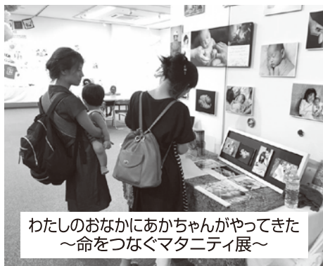
わたしのおなかにあかちゃんがやってきた ～命をつなぐマタニティ展～

いつもラディッシュ新聞のご愛読誠にありがとうございます。残暑厳しですが夏バテは大丈夫でしょうか。体調を崩されている方もいらっしゃるのでは。季節の変わり目は皆さん気を付けて下さいね。 さて、これからは徐々に気温も下がり過ごしやすくなると思いますが暑さが苦手な私にとっては待望の秋シーズンです。早く雪が降ってこないかなと思う今日この頃です。 ガス業界としてはこれからのシーズンは1年で一番大きいイベント「ガス展」が始まります。なかなかガス機器の展示会は少ないので昨年度も本音に皆さんの方々に「米場頂きました。本年度も抽選会含め楽しんでイベントをご用意しておりますので是非足を運んで頂ければと思います。 大阪ガスのCMでも流れていますが、現在は多岐にわたってお客様に喜んで頂けるサービスが始まっております。この機会にお気軽にご相談下さい。先ずは年間最大イベント、ガス展にてお待ちしております。