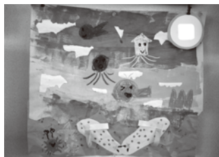
海とビーチサンダル 年長SM