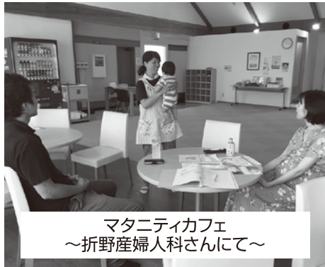
マタニティカフェ ～折野産婦人科さんにて～