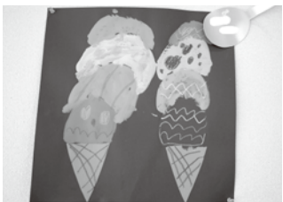
アイスクリーム 年少YS