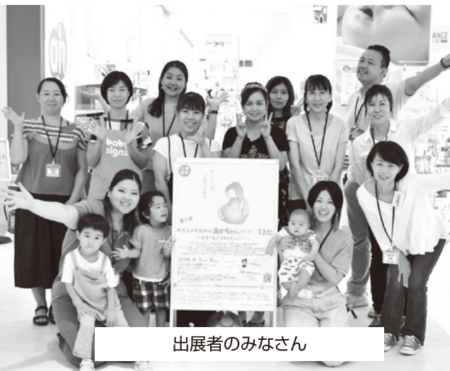
出展者のみなさん