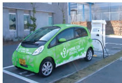
電気自動車の導入

利子所得として 20.315% (所得税 15.315% + 地方税 5%) が課税されます。